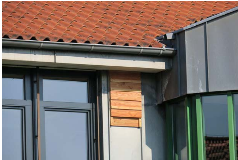
Bild: Fledermausbrett am Kreishaus in Wildeshausen

Sofern eine größere Wandfläche zur Verfügung steht, können Sie zwei bis drei Kästen verteilt aufhängen. Wichtig dabei ist, die Mindesthöhe von drei Metern einzuhalten. Achten Sie darauf, dass die Anflugbahn unterhalb des Kastens mindestens einen Meter frei von Hindernissen ist.