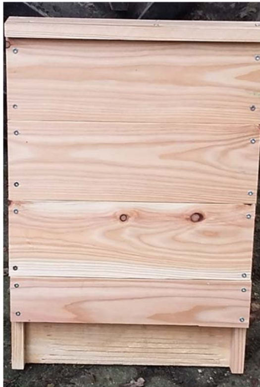
Bild: Fledermausbrett nach Bauanleitung

Auf der Rückseite finden Sie eine Bauanleitung zum Bau eines Fledermausbrettes in den Maßen 40 cm Breite und 60 cm Höhe!