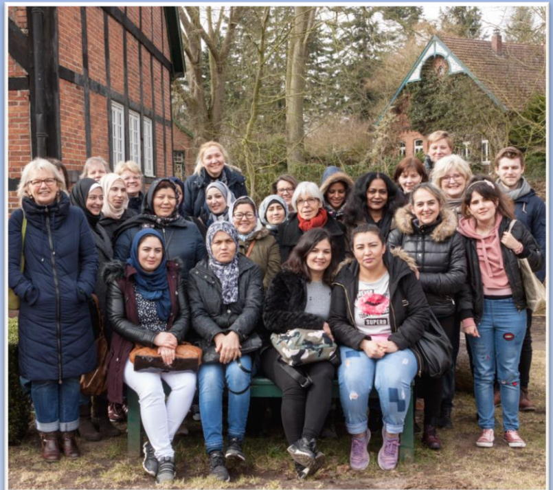
Mühle, Klosterschänke in Hude