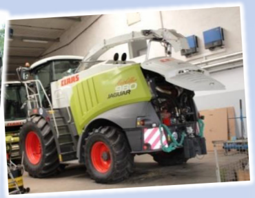
Betrieb Kuhlmann und Spille Landmaschinen, Lohnunternehmen, Agrarservice-Leistungen