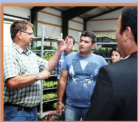
Betrieb Jens Schachtschneider Staudengärtnerei