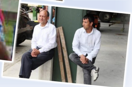
Rechts im Bild: Unsere Fotografin Susanne Syberberg