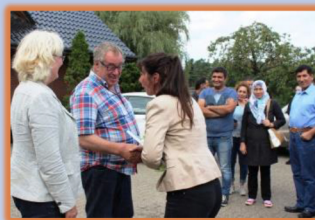
Betrieb Gerold Stühr Rhader Sand GbR

Milchviehhaltung, Rinderaufzucht, -mast, Energieerzeugung (Biogas), Ackerbau, Grünland